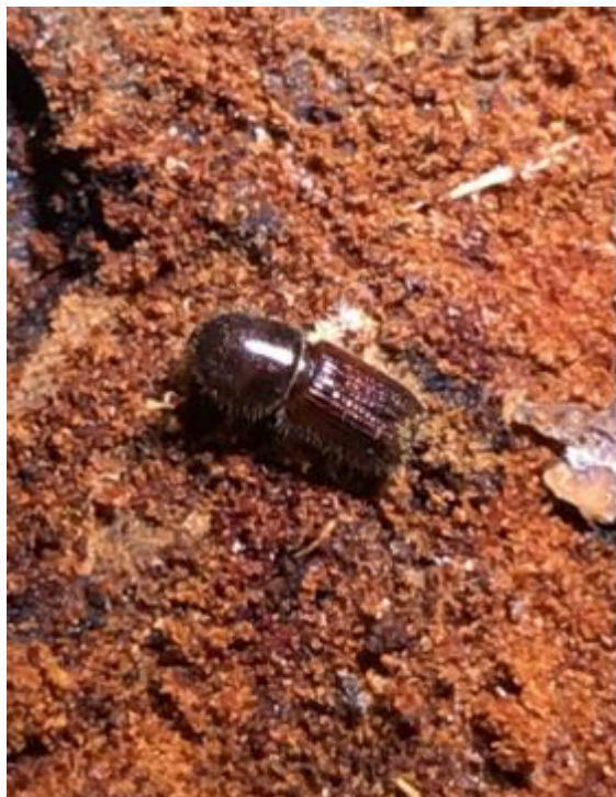
Slika 1. Mediteranski potkornjak Orthotomicus erosus

Iz svih uzoraka izašli su potkornjaci vrste Orthotomicus erosus (Slika 1).