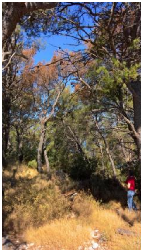
Slika 2. Sušenje alepskog bora na Marjanu

Sušenje alepskih borova Pinus halepensis u ovakvim razmjerima potpuno je nova pojava u Hrvatskoj te su potrebna intenzivna i sveobuhvatna istraživanja kako bi se dobila potrebna saznanja u poduzimanju mjera zaštite (Slika 2).